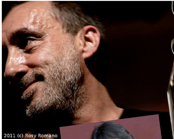
2011